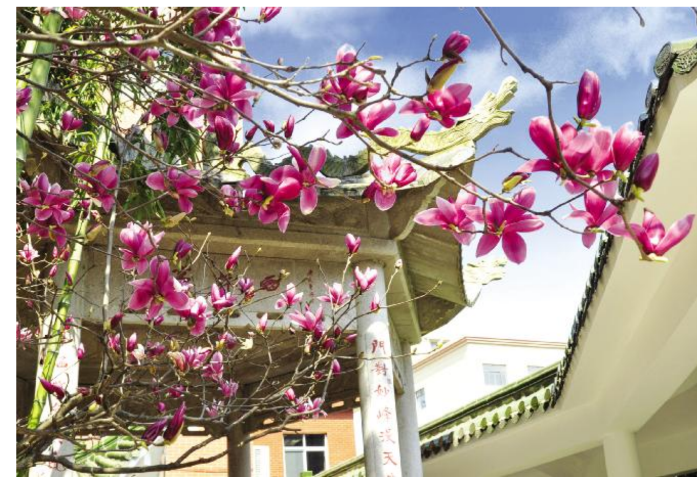
春意如意