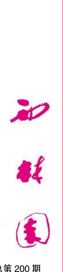
总第 200 期